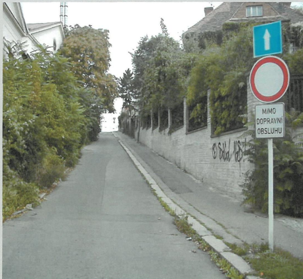
Typ: Jpeg obrázek Rozměry: 640 x 480 px Lupa: 144 %